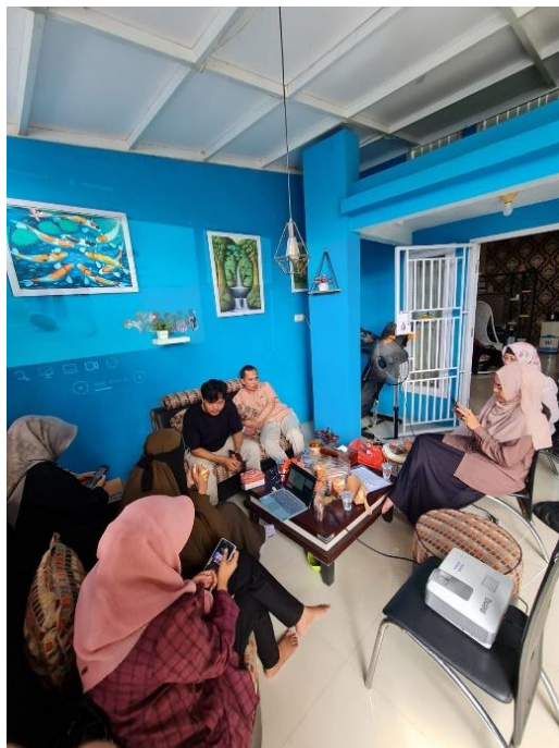
Gambar 1. Pelatihan branding untuk pengelola UMKM Sambal Pecel Kanaya

Pelatihan branding yang dilakukan berhasil memberikan pemahaman yang lebih dalam tentang elemen-elemen penting dalam menciptakan merek yang kuat dan konsisten. Pengelola UMKM diberi materi tentang pembuatan logo, desain kemasan, dan penentuan nilai yang ingin disampaikan melalui produk mereka. Sebagai hasilnya, Sambal Pecel Kanaya berhasil merancang identitas merek yang lebih profesional, dengan kemasan yang lebih menarik dan mudah dikenali oleh konsumen. Branding yang lebih konsisten ini merupakan langkah awal yang sangat penting untuk membedakan produk mereka di pasar yang kompetitif.