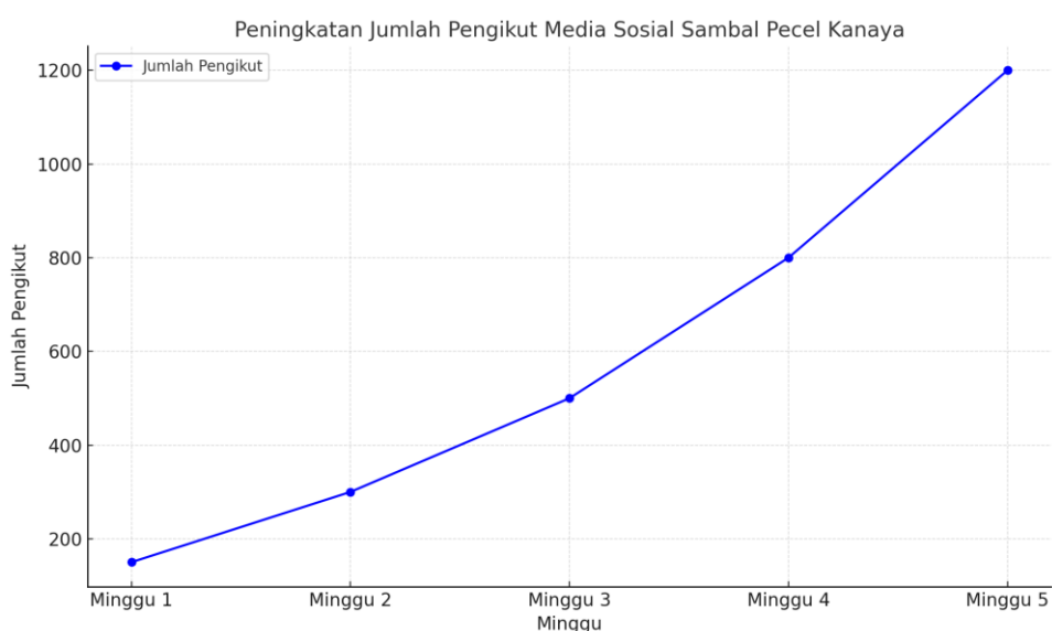
Gambar 3. Peningkatan jumlah pengikut media sosial Sambal Pecel Kanaya

Setelah itu, pelatihan pemasaran digital dilaksanakan untuk memperkenalkan penggunaan media sosial dan platform e-commerce sebagai alat pemasaran yang efektif. Pengelola UMKM belajar cara mengelola akun media sosial seperti Instagram dan Facebook serta membuat konten yang menarik untuk meningkatkan interaksi dengan konsumen. Meskipun beberapa pengelola awalnya merasa kesulitan dengan pemasaran digital, mereka akhirnya dapat menguasai cara memasarkan produk melalui platform-platform ini. Hasil dari pelatihan pemasaran digital ini terlihat jelas dengan meningkatnya jumlah pengikut di akun media sosial mereka serta bertambahnya interaksi dengan konsumen.